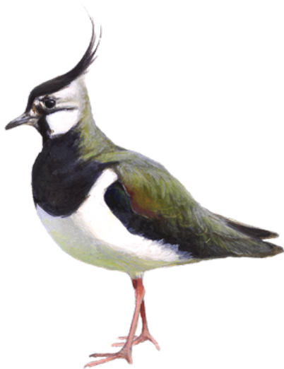
In ljip (= kievit)

Kies út: rinne, sliepe, sjen, switte, swimme