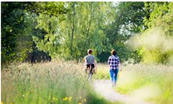
Sy binne tegearre oan it kuierjen

15. Is er dan niemand die met mij wil wandelen?